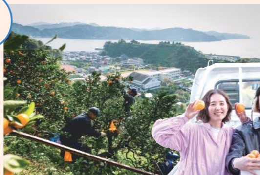
柑橘の名産地・宇和島市吉田町。若者の生産者も多い。