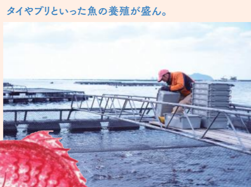
タイヤブリといった魚の養殖が盛ん。