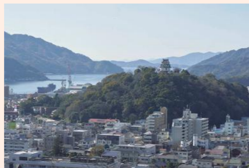
まちのシンボル「宇和島城」