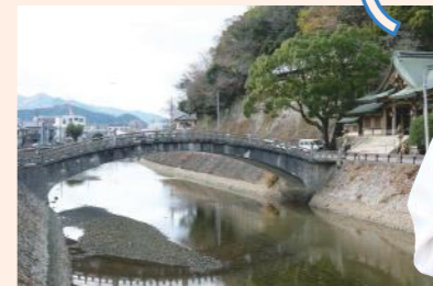
地元で愛される「和霊神社」。壮大な「和霊大祭」も有名。