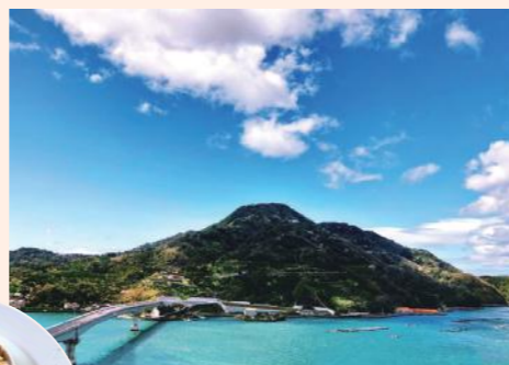
中心部から車で10分ほどの「九島(くしま)」。