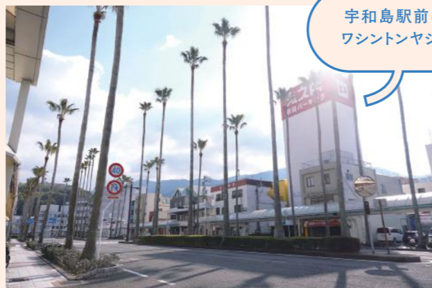
宇和島駅前にワシントンヤシ!

人口約70,000人と、愛媛県南予地域で最大のまち。宇和島城の旧城下町で、闘牛や祭りなど独特の伝統・文化が息づく。沿岸部は宇和海に面したりアス式海岸が続き、その地の利を生かした鯛や真珠などの養殖業、柑橘栽培がさかん。内陸部では、肥沃な大地がはぐくむ田園風景が点在する。人とのつながりや風景の豊かさといった“田舎”暮らしの良さと便利な暮らしの“いいとこ取り”をしたい人に特におすすめ。