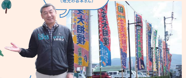
相撲とお酒が好きなまち・野村地区。乙亥(おとい)会館では160年以上続く伝統の「乙亥大相撲」が開催される。