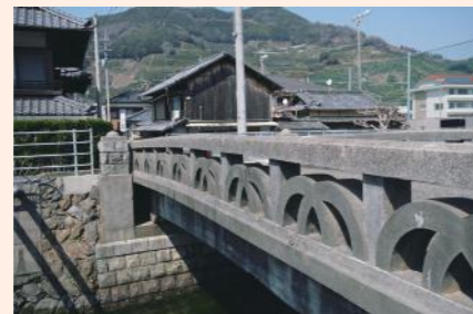
柑橘産地の明浜地区。産地を盛り上げる若者の姿が目立つ。