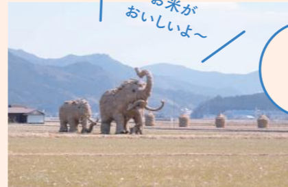
田畑の風景がどこまでも続く宇和地区。田んぼに立つワラマンモスはまちの人気者。