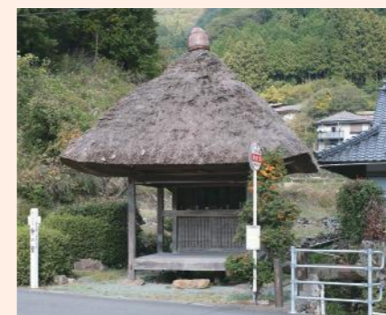
城川地区を中心に「茶堂」が点在。かつてお運路さんを“お接待”していた場所。