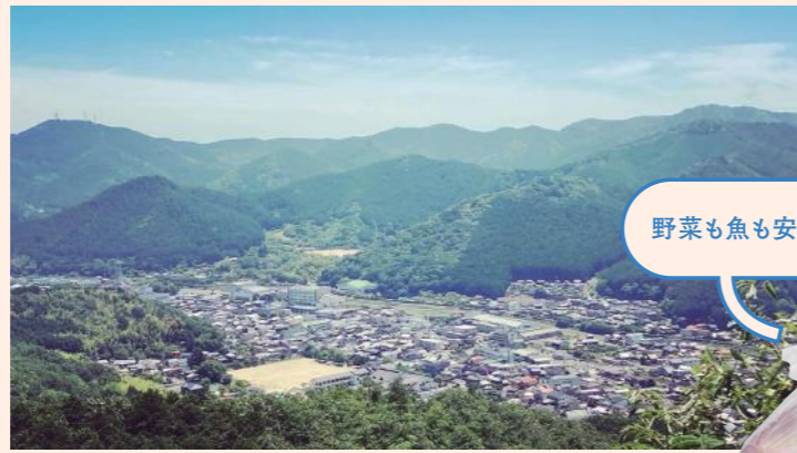
標高約200mの「宇和盆地」に広がる、西予市の中心地。