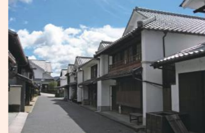
宇和町卯之町の伝統的な町並み。四国最古級の小学校なども残されている。