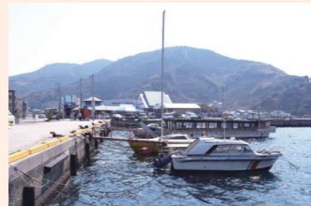
宇和地区から山を越えれば三瓶地区。宇和海のそばに息づく小さな港町。