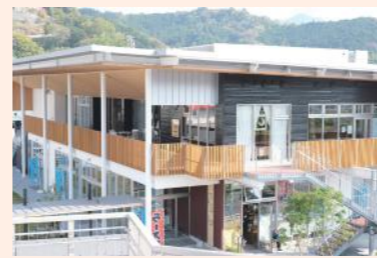
JR卯之町駅前の複合施設「ゆるりあん」。まちと人と交流できたり、西予のおいしいものに出会えたり。