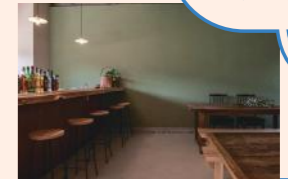
野村地区の集落に溶け込むゲストハウス。バーも併設している。