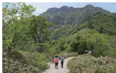
西日本最高峰「石鎚山」(標高1982m)

豊かな自然と生活に不便を感じさせない都市機能とが両立し、ICT教育や子育て環境の充実を進めていることから、特に若者・子育て世代から移住先として支持されています。