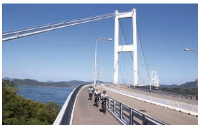
瀬戸内しまなみ海道サイクリング

平成17年1月に12市町村の合併により、松山市に次ぐ県下第2の都市に生まれ変わりました。瀬戸内海の風光明媚な景観と、大山祇神社や村上海賊の海城址などの歴史遺産を誇る観光都市として、また、国内における建造集積数は約2割を占め、日本の海運企業が所有する外航船の約4割を今治の船主が占めるなど、造船・海運都市としても将来が期待されています。