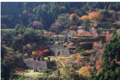
別子銅山(東洋のマチュピチュ)

新居浜市は、四国のほぼ中央に位置し、南は四国山地、北は瀬戸内海に面した、自然豊かなまちで、沿岸地域には住友関連の工場群が形成された、四国屈指の臨海工業都市です。近代化産業遺産をはじめとする歴史や文化など、数多くの地域資源があり、観光施設「マイントピア別子」のほか、令和5年3月末からは、国登録有形文化財の「旧端出場水力発電所」の一般公開が始まりました。毎年10月に行われる豪華絢爛な「新居浜太鼓祭り」は、県内外から多くの観光客が訪れ、四国三大祭りのひとつに数えられています。また、大型ショッピングモールや大型遊具が設置されている公園、総合病院が4つあるなど子育て世代が住みやすい環境も整っています。