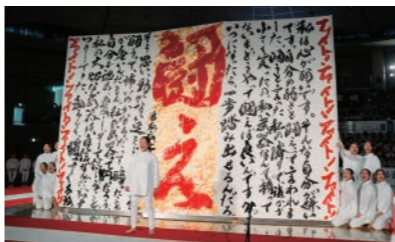
書道パフォーマンス甲子園

四国中央市では、「子育て環境四国一!」を目指して、子育ての応援や支援に取り組んでいます。