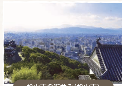
松山市の街並み(松山市)