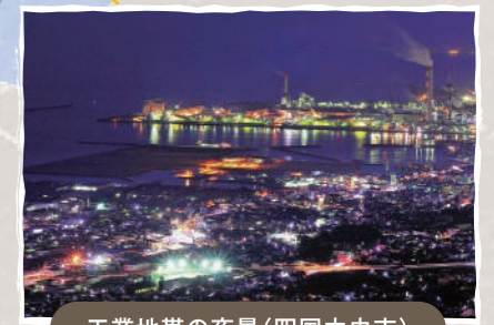
工業地帯の夜景(四国中央市)