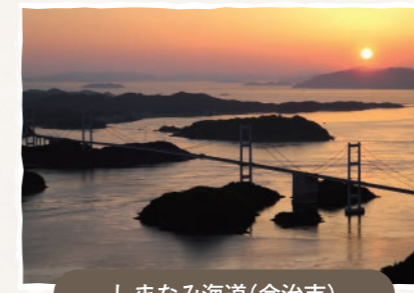
しまなみ海道(今治市)