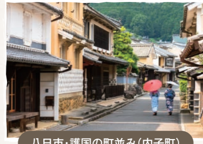
八日市・護国の町並み(内子町)