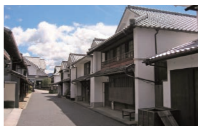
重要伝統的建造物群保存地区「卯之町」

また、西予市は、平成25年に市内全域が四国西予ジオパークとして認定を受け、大地が育んだ多様な自然や生態系、また、様々な文化やそこで暮らす人々の営みを丸ごと感じることができる地域です。食・文化・伝統・自然環境など、都会では味わえない魅力を肌で感じていただき、いずれ私たちと一緒に西予市で暮らしてみたいと思っていただければ幸いです。