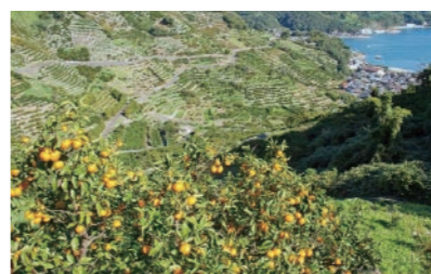
重要文化的景観「狩浜の段々畑」