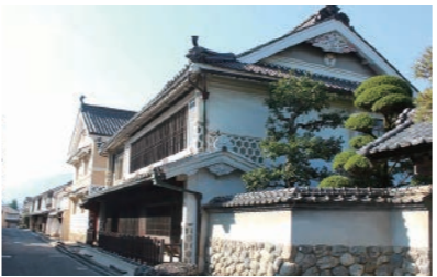
八日市・護国の町並み

江戸時代から明治にかけて、木蠟生産で栄えたまち内子町。上芳我家住宅、本芳我家住宅、大村家住宅、内子座の4つの国の重要文化財があり、当時の町家が保存されている八日市・護国の町並みは、重要伝統的建造物群保存地区となっています。秋は美しい紅葉が楽しめる「小田深山溪谷」、世界の風を展示している「五十崎風博物館」など、季節を感じられるレジャースポットも点在。「道の駅内子フレッシュパークからり」は、平成27年度全国モデル道の駅に選定された人気スポットで、内子町の豊かな自然が育んだフルーツや野菜を購入することができます。総合計画の重点施策として移住促進を掲げており、空き家バンクの情報も充実しています。