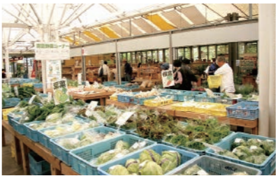
道の駅 内子フレッシュパークからり