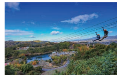
とべもりジップライン

地域振興課 コミュニティ支援係 〒791-2195 愛媛県伊予郡砥部町宮内1392 [TEL]089-962-7250 [FAX]089-962-4277 [E-mail]023chiiki@town.tobe.ehime.jp [町HP]https://www.town.tobe.ehime.jp [移住HP]https://www.town.tobe.ehime.jp/soshikikarasagasu/chiikishinkouka/iju/1137.html