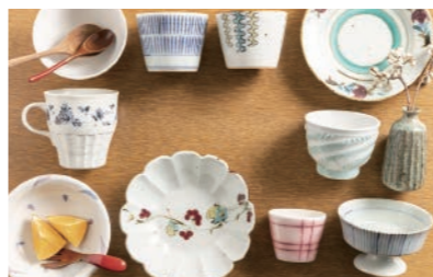
国の伝統的工芸品「砥部焼」

愛媛県の中央部に位置しており、県都松山市に隣接しております。北部は250余年の歴史を持つ国の伝統的工芸品「砥部焼」の産地であり、80余りの窯元が点在する焼き物の里です。また、温暖な気候とあいまって、柑橘栽培が盛んです。「とべ動物園」、「えひめこどもの城」、「総合運動公園」などのレジャー施設も立地しています。南部は豊かな森林資源や自然景観が美しい山間地域で、初夏には天然の源氏ホルタルが乱舞し、幻想的な世界を楽しむことができます。また、自然条件を活かした高原野菜や自然薯の栽培が盛んです。町内施設を巡るセミオーダー型移住体験ツアーも受付中です。県外からの参加など、条件を満たせば宿泊費を助成します。