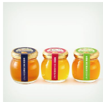
【伊方町】 08 3種の蜜を食べ比べ はちみつ 3種セット 120g×3本 <みかんの花・春・夏>

問合せ/まるまど https://www.instagram.com/marumado.bakery