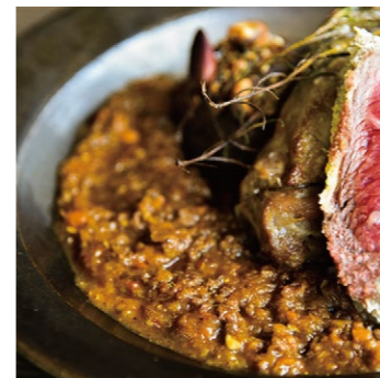
【西予市】 03 肉好きにはたまらない一皿 はなが牛キーマカレー

問合せ/完熟屋 (佐田岬共販) http://www.kanjyukuya.com