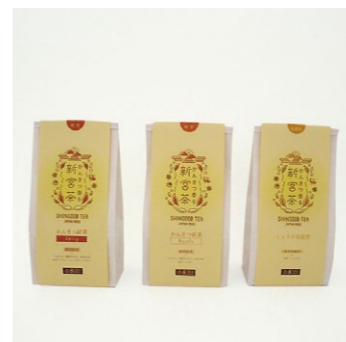
【四国中央市】 05 香り高いお茶で一服 かんきつ紅茶 (Basic・Spicy) しょうが烏龍茶

愛媛のお茶どころ四国中央市新宮町でつくられた柑橘ブレンドの紅茶と烏龍茶。ほっと一息ティータイムに。3g×8個入り 648円