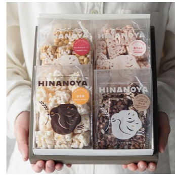
【西条市】 04 手がとまらないお米のお菓子 ボン菓子4種詰合せ箱 (キャラメルナッツ/伊予柑/えひめのハダカ麦と玄米チョコ/苺チョコ)

地元契約農家の米を使用したボン菓子。伊予柑など愛媛の味も楽しめる。写真は冬春限定商品(4種 2078円)。時期によりセット内容・価格の変更あり。