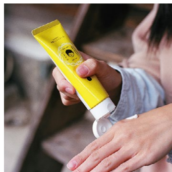
【西予市】 10 甘い香りで潤う、ボディケア yaetoco ボディケア 家族ハンドクリーム (伊予柑)

問合せ/ IKEUCHI ORGANIC https://www.ikeuchi.org