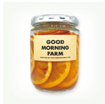
【内子町】 06 柑橘の美しさと美味しさを一瓶に ブラッドオレンジシロップ煮

問合せ/シトラス&アロマ 島香房 https://shimakobo-omishima.com