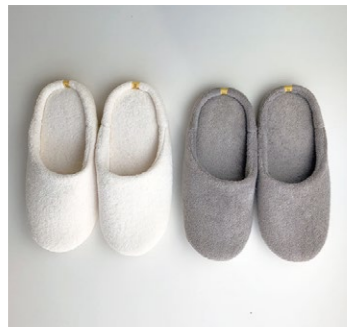
【今治市】 09 素足で感じる心地よさ オーガニック 120 ルームシューズ S

今治タオルのルームシューズ。直接素足に触れる部分はオーガニックコットン 100%のパイルのみで、クッションのように弾力ある履き心地。4620円