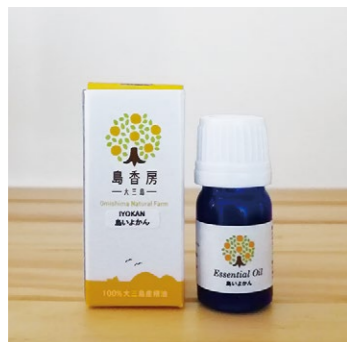
【今治市】 11 柑橘農家が届ける島の香り 島いよかん精油

大三島で栽培された無農薬栽培の伊予柑の精油。爽やかさの中にほんのり甘みのある香りで、リフレッシュとリラックスに。3mL 1800円