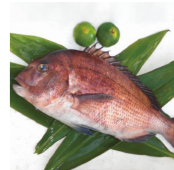
【宇和島市】 01 お刺身やムニエルに まるごと真鯛セット

出荷当日の朝に活きメした真鯛を調理しやすく加工。櫛状フィーレ4枚、カマ付き頭(2分割)、ハラミ2枚(約1.5kgの真鯛1尾分)のセット 3240円