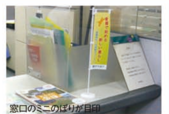
窓口のミニのばりが目印

愛媛県への移住交流希望者を応援するため、伊予銀行の四国外支店26店舗に「愛媛移住・交流紹介コーナー」を設置しています。