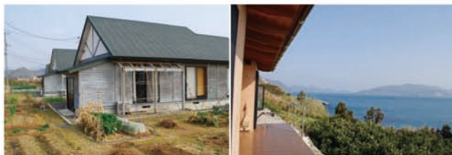
▲滞在農園のラントウレーベン

「田舎の生活というのは、地域の人と深く関わりつつ、不便も受け入れながら暮らしそのものを楽しむ姿勢が大事ではないでしょうか。私の経験から、この島に移住を考えている人の力になることがあれば、何でも相談に乗ろうと思います。」と話していただきました。