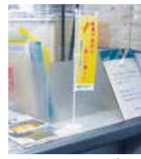
▲窓口のミニのほりが目印

伊予銀行では、四国外にある26店舗(海外店を除く)で「愛媛移住・交流紹介コーナー」を設置して、愛媛への移住に関する情報提供や「愛媛ふるさと暮らし応援センター」の紹介を行っています。愛媛県へのU・Iターンを考えていらっしゃる方々は、お近くの伊予銀行支店の窓口もご利用いただけますようご案内します。