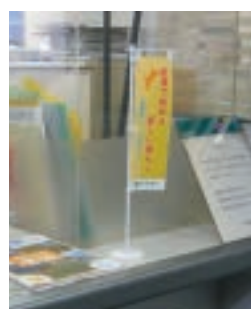
▲窓口のミニのぼりが目印

愛媛県への移住・交流希望者を応援するため、伊予銀行の四国外支店26店舗に「愛媛移住・交流紹介コーナー」を設置しています。愛媛県へのU・Iターンを考えていらっしゃる方は、お近くの伊予銀行四国外支店の窓口もご利用ください。