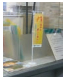
▲窓口のミニのぼりが目印

愛媛県への移住・交流希望者を応援するため、伊予銀行の四国外支店26店舗に「愛媛移住・交流紹介コーナー」を設置しています。愛媛県へのU・Iターンを考えていらっしゃる方は、お近くの伊予銀行四国外支店の窓口もご利用ください。